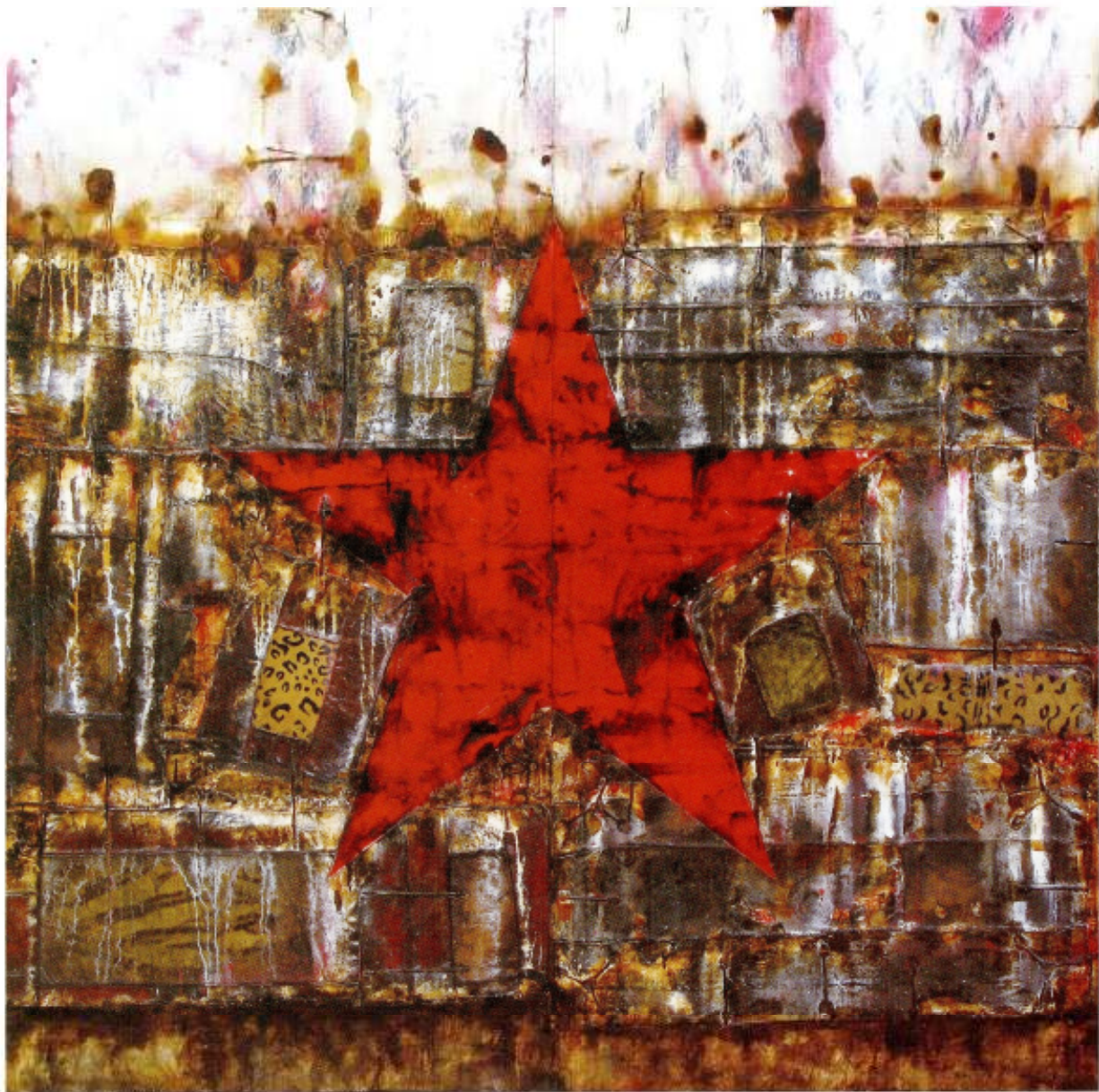
红星与箱子 综合材料 200cm×200cm 2008年

的欣赏底蕴，现在我就想在画面中表现这些东西。这和中国天人合一的自然美学理想是一脉的。能够理解和欣赏这种美，是需要一些中国文化的知识和修养的，这和西方的美学是不一样的。西方人买了明式家具，拿回去把家具表面刨光见新。我们叫“给家具洗澡”，理解不了我们为什么喜欢古老家具破旧的表面。东西方过去是两个完全不同的文化系统，我现在力图探求这两个体系固有的特性以及在艺术创造中如何保存与融合，对自身文明抱有坚定的信念，就赋予了艺术家重新界定何谓现代的能力。