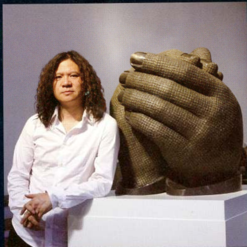
为你鼓掌 青铜雕塑 H72cm 2008年

后或90后的艺术家竞争会更加激烈，生活中各方面渐趋国际化，逐渐纳入到一个共同的体系中，所依靠的文化独特性逐渐失去。