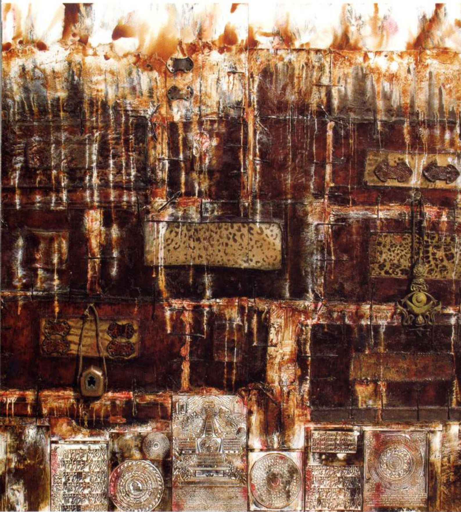
1- 天空与大地 / 综合材料 / 220x220cm / 2009