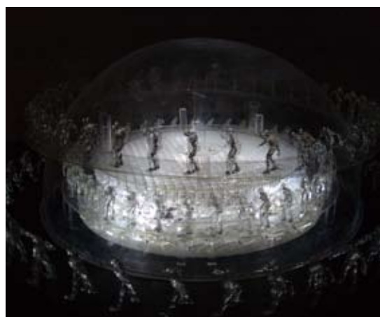
《轉山》 機械裝置，190cm x 165cm