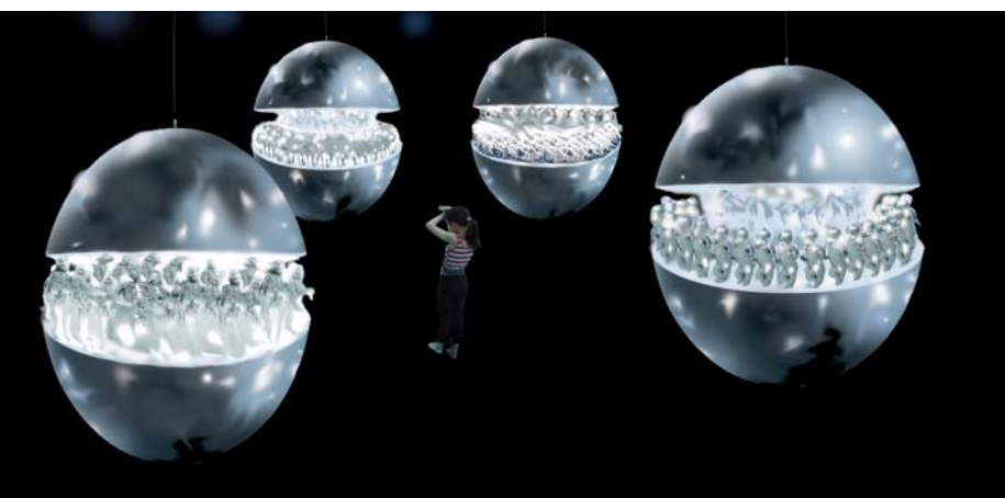
《蛋形No.1-4》，機械裝置 (不銹鋼板、透明樹脂，有機玻璃，玻璃鋼，電子燈、機械傳動)

四川綿陽人 1961年4月16日出生 四川美術學院版畫系畢業 1992年移居英國 活躍於中國、英國等各大 國際藝術展覽