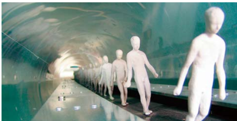
《隧道》機械裝置，3 x 600cm(L) x 65cm(H) x 52cm(W)